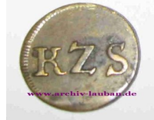
Kirche zu Schwerta