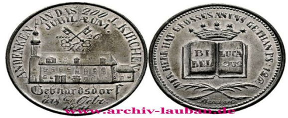
Gedenken an das 200 jährige Kirchenjubiläum 1854

Kirchgeld von Meffersdorf, Volkersdorf und Schwerta