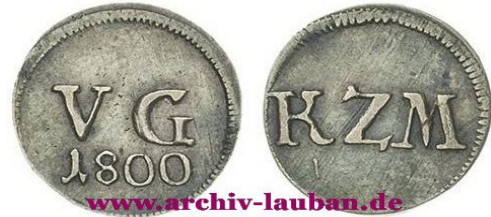
Kirche zu Meffersdorf

Kirchgeld von Meffersdorf, Volkersdorf und Schwerta