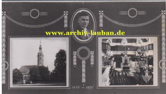
Gedenkmappe zum Kirchenjubiläum 156-1931