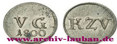
Kirche zu Volkersdorf

Sonderprägungen des Kirchenpatron Adolf Traugott von Gersdorf, wegen des deutlichen Rückgang der Klingelbeutelerträge Ende 18., aufgrund Mangel des im Umlauf befindlichen sächsischen Groschen. Prägung nur für diese 3 Orte im Queiskreis.