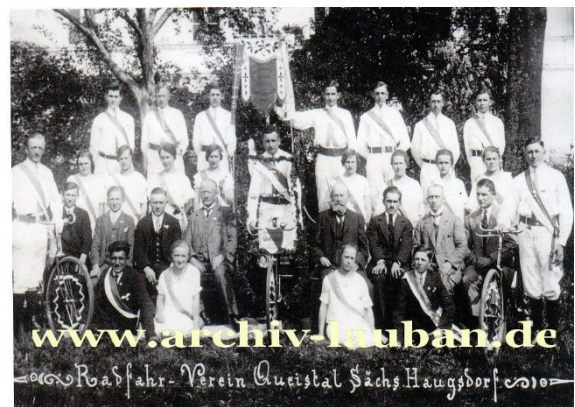
Radfahrverein „Queistal“ aus sächs. Haugsdorf im Jahr 1910