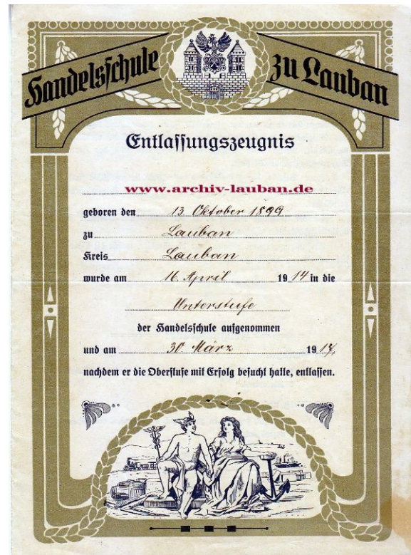
Handelsschule Lauban 1917 (Stiftung)