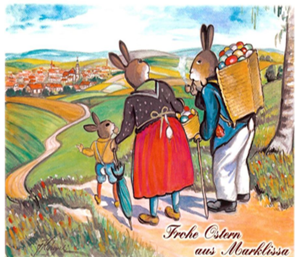
Künstlerkarte Janusz Kulzycki

Bitte beachten Sie die Rückmeldung-Bitte im aktuellen Laubaner Gemeindebrief, hinsichtlich einer denkbaren Teilnahme am nächsten Laubaner Heimattreffen in Hildesheim!