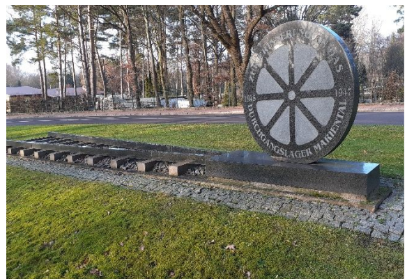
fol. Beckert 2022

! Die Transportlisten lagern heute im ! ! Staatsarchiv Wolfenbüttel. ! ! (Zug- und Waggonlisten ! ! mit Personenangaben) !