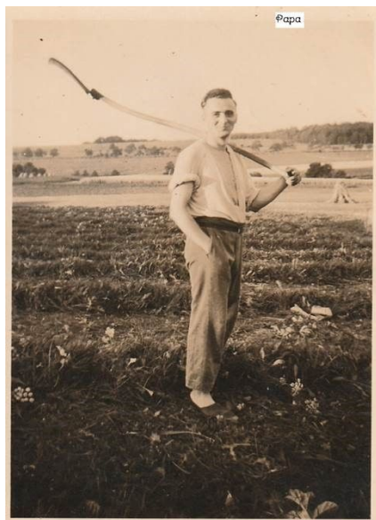
Eingesetzt im Raum Gerlachsheim / Marklissa In der Landwirtschaft (im Hintergrund der Spitzberg bei Heidersdorf?)